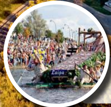
27. augustil – XVI LŠti Üleüldised Piima-, leiva- ja meepševad, XIV Piimapakkidest tehtud paatide regatt