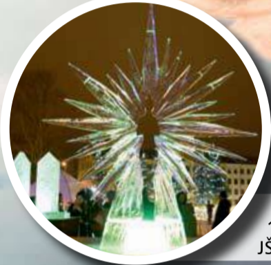
5. – 7. veebruaril – 18. Rahvusvaheline JŠŠskulptuurifestival