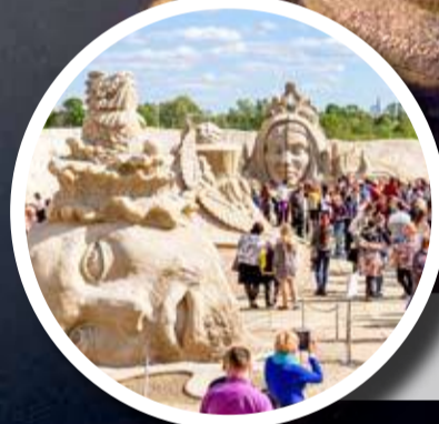
11. – 12. juunil – 10. Rahvusvaheline Liivaskulpuurifestival