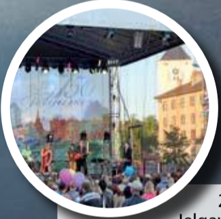
27. – 29. mail – Jelgava Linnapševad (toimuvad kogu linnas, ka Postisaarel)