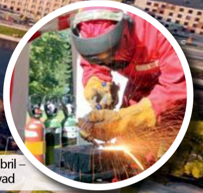
10. septembril – Metallipševad