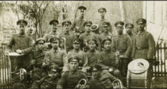
Sotilaallinen puhallinorkesteri Das Militärblasorchester