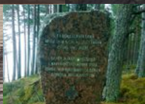
Uusittu suomalaisten jääkäreiden monumentti Klappkalnciemsissa Der restaurierte Gedenkstein den Jägern in Klappkalnciems