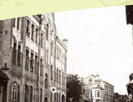
Sotasairaalan rakennus Jelgavassa, Svēten kadulla, jossa hoidettiin suomalaisjääkäreitä Lazarethhaus in Mitau, in der Svetes Straße, wo sich finnische Jäger in Behandlung waren

Als am 6. Dezember 1917 hat Finnland seine staatliche Unabhängigkeit erklärt, wollten die finnischen Jäger nach Heimat kehren. Sie demissionierten von der deutschen Armee und am 13. Februar 1918 leisteten ihren Eid der legitimen Regierung Finnlands in der Kirche der Heiligen Dreifaltigkeit in Libau. Ebendort wurde die jägerische Flagge geweiht. Die jägerische Hauptgruppe kehrte nach Finnland aus Libau genau drei Jahre nach dem Ausbildungsbeginn, am 25. Februar 1918. In Finnland entwickelte sich der Bürgerkrieg, in dem die Jäger im Zustand von Regierungstruppen teilgenommen hatten. In dem unabhängigen Finnland bildeten und entwickelten die Jäger die staatliche Armee, sie waren an derer Spitze in der Kriegszeit seit 1939. bis zum 1940. Jahr, sowie im Zweiten Weltkrieg seit 1941. bis zum 1945. Jahr. In beiden Kriegen verteidigten die Finnen ihre Unabhängigkeit. Die Finnen verehren die Jäger, ihre Traditionen und kümmern sich darum, dass die historischen Verbindungen zwischen den Generationen verblieben, und jede nächste Generation davon wüsste.