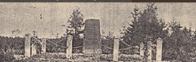
Galiñin vieressä sijaitseva muistomerkki kaatuneiden suomalaisten jääkäreiden kunniaksi paljastamisen jälkeen vuonna 1925 Gedenkstein den gefallenen finnischen Jägern am Galiñi nach der Eröffnung im Jahre 1925