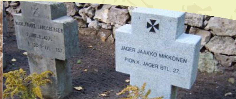
Kaatuneen suomalaisjääkäriin lepopaikka Lāčin hautausmaalla Kalnciemsin vieressä Grab des jägerischen Kriegers auf dem Lācu Friedhof am Kalnzeum