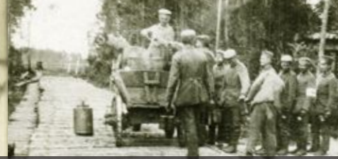
Maaseudun keittiö on saapunut puutikku -fašinatietä myöten Die Feldküche ist durch den Weg aus Faschinen und Stäben gekommen