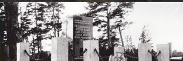
Neuvostoaikana tuhotun suomalaisten jääkäreiden muistopaikka Klappkalnciemsissa In der Sowjetzeit zerstörte Gedenkstätte den finnischen Jägern in Klappkalnciems