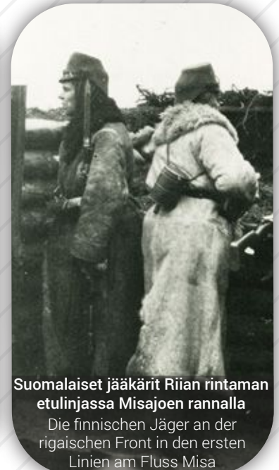
Suomalaiset jääkärit Riian rintaman etulinjassa Misajoen rannalla

Der finnische Jäger an der Befestigungsmauer ohne militärische Ausrüstung