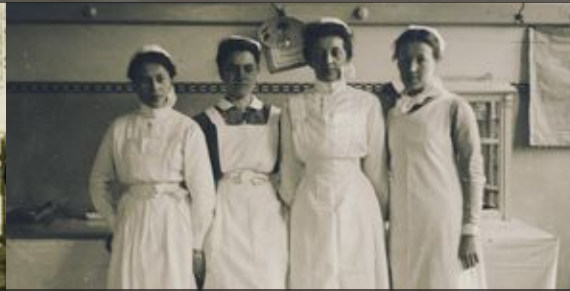
Vapaaehtoiset sairaanhoitajat -haavoittuneiden ja sairaiden sotilaiden hoitajattaria Freiwillige Krankenschwester - die Verwundeten und kranke Soldaten