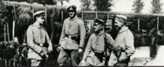
Kevään tulvissa suomalaisten jääkäreiden asemat olivat tulvineina ja turvakodiksi palveli puisen rakennetta sekä maanpäällistä korsua

Die jägerischen Positionen wurden im Frühling überflutet, und als Deckung dienten die hölzernen Verteidigungswallen und Bodenbunker