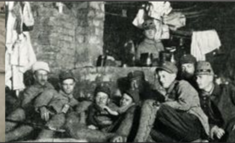
Jääkäriryhmä levossa Die Jägergruppe in der Ruhe

Suomalaisten sotilaiden koulutus alkoi 25. päivänä helmikuuta 1915 Saksassa – Lockstedtissa Hampurin läheisyydessä. Sodan aikana täällä koulutuksen sain noin 2000 sotilasta Suomesta. Toukokuussa 1916 luotiin Kuninkaallinen Preussin Jääkäripataljoona nro 27. Jääkärit - kevyesti aseistettuja ja nopeasti liikkuvia jalkaväkisotilaita, jotka voisivat suorittaa taistelutehtävän metsäisessä ja epätasaisessa maastossa, sekä mennä taisteluedusteluun vastustajan hallitsemalle alueelle. Jotta pataljoona saisi taistelukokemusta, se oli lähetetty itärintamalle Kuurinmaalla, nykyisen Latvian alueella. Pataljoona osallistui taisteluihin Misajoen rannalla Dalben vieressä, Kalnciemsissa ja Riianlahden rannalla Klappkalnciemsin vieressä. Noin vuosi pataljoona sijaitsi koulutuksessa rintamalinjan selustassa Liepājassa.