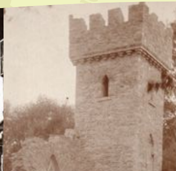
Rintama-aikana Tetelminden kartano toimi sotilaiden lepokotina Auf dem Tetelmindes Guthof ruhten sich die finnischen Jäger zwischen den Kämpfen aus