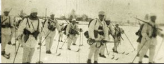
Talven naamiomispuvuissa Kalnciemsin vieressä Joulutaistelujen aikana 24 päivänä tammikuuta 1917 In Wintertarnanzügen am Kalnzeum in den Weihnachtsschlachten am 24. Januar 1917

Die jägerischen Positionen wurden im Frühling überflutet, und als Deckung dienten die hölzernen Verteidigungswallen und Bodenbunker