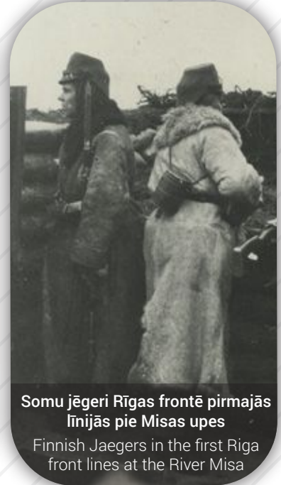
Somu jēgeri Rīgas frontē pirmajās līnijās pie Misas upes Finnish Jaegers in the first Riga front lines at the River Misa