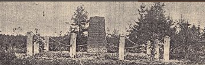
Piemineklis kritušajiem somu jēgeriem pie Galiņiem pēc tā atklāšanas 1925.gadā Monument to the fallen Finnish Jaeger in Galiņi in 1925