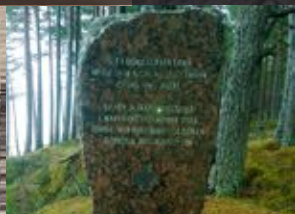
Atjaunotais somu jēgeru pieminēklis Klāpkalnciemā The restored Finnish Jaeger monument in Klāpkalnciems