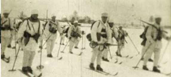
Ziemas maskēšanās tērpos pie Kalnciema Ziemassvētku kauju laikā 1917.gada 24.janvārī In winter camouflage uniforms at Kalnciems during Christmas battles on 24 January 1917