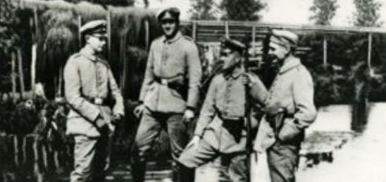
Pavasara plūdus somu jēgeru pozīcijas applūda, un par patvērumam kalpoja koka valņi, kā arī virszemes blindāžas Finnish Jaeger lines were flooded in spring floods, and wooden ramparts, as well as surface blindage served as a shelter