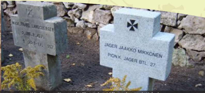
Kritušā somu jēgera apbedījuma vieta Lāčkrōga kapos pie Kalnciema Fallen Finnish soldiers burial site in Lāčkrōga graveyard in Kalnciems