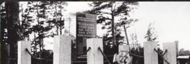
Padomju laikos nopostīta somu jēgeru pieminēklis Klāpkalnciemā The Finnish Jaeger memorial site in Klāpkalnciems that had been destroyed in the Soviet times