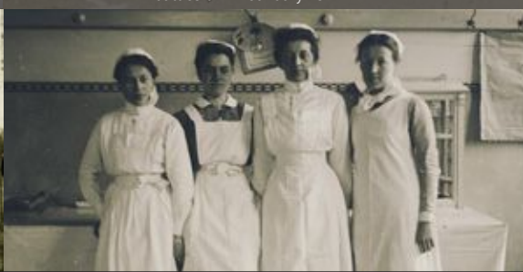
Brīvprātīgās medmāsas ievainoto un slimo karavīru kopējas Voluntary nurses taking care of the wounded soldiers