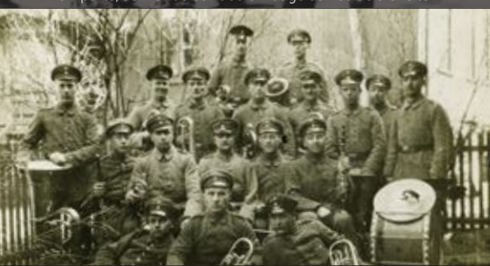
Militārais pūtēju orķestris Military brass band