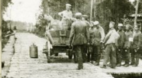
Lauku virtuve atbraukusi pa koka sprunguļu - fašīnu ceļu Country cuisine has arrived along wooden stick - fascine road