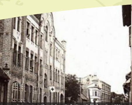
Lazaretis ēka Jelgavā, Svētes ielā, kur ārstējās somu jēgeri Lazarete building in Jelgava, Svētes street, where the Finnish Jaegers received medical care

When on 6 December 1917, Finland declared its independence, the Finnish Jaegers wanted to return home. They retired from the German army and on 13 February 1918 in Liepāja Holy Trinity Church swore confidence to the legitimate Government of Finland. At the same place the Jaeger flag was consecrated. The main Jaeger group returned to Finland from the Liepāja exactly three years after the start of training, on 25 February 1918. A civil war had been started in Finland and the Jaegers took part in the composition of the government troops. In Independent Finland the Jaegers created and trained the national army, they were also at the forefront during the Winter War from 1939 to 1940 and during World War II from 1941 to 1945. The Finns defended their independence in both wars. Finns honour the Jaegers, their traditions and take care that the historical ties between the generations are preserved to pass the knowledge over to the next generations.