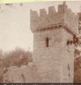
Tetelmīndes muižā somu jēgeri atpūtās kauju starplaikos Tetelmīnde Manor where the Finnish Jaegers had a rest in between battles