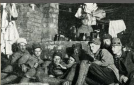
Jēgeru grupa atpūtā Jaeger Group during a moment of recreation

Somu karavīru apmācība sākās 1915.gada 25.februārī un notika Vācijā - Lokštedā pie Hamburgas. Kara laikā šeit apmācības kursu izgāja aptuveni 2000 somu karavīru. 1916. gada maijā tika izveidots 27.Karaliskais Prūsijas Jēgeru bataljons. Jēgeri – viegli bruņoti strēlnieki, kas varēja veikt kaujas uzdevumus mežainā un šķēršļotā apvidū, kā arī veikt izlūkgājienu pretinieka kontrolētajā teritorijā. Lai bataljons iegūtu kaujas pieredzi, to nosūtīja uz austrumu fronti Kurzemē, tagadējā Latvijas teritorijā. Bataljons piedalījās kaujās frontē starp Misas upi pie Dalbes, Kalnciemā un Rīgas jūras līcī pie Klāpkalnciema. Apmēram gadu bataljons atradās mācībās aiz frontes līnijas Liepājā.