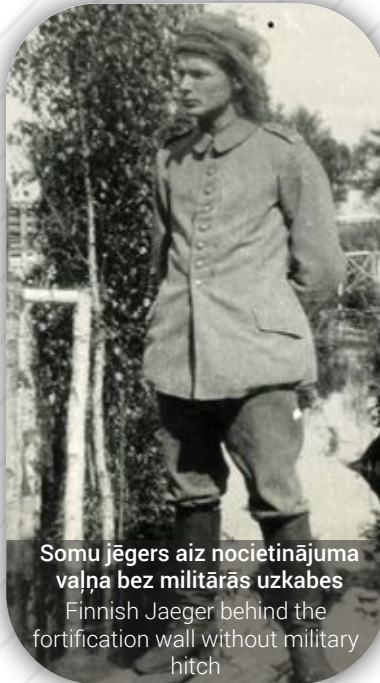
Somu jēgers aiz nocietinājuma vaļņa bez militārās uzskabes Finnish Jaeger behind the fortification wall without military hitch

In the early 20th century the idea of Finnish independence was born in Finland, despite the fact that from 1809 for more than a century it was in the composition of the Russian Empire. In 1914, with the beginning of World War I, Finnish students established a secret movement, with the aim of fighting for the secession of Finland from the Russian Empire. The German Government allowed establishing a Finnish armed unit as a part of the German Army. 200 Finns applied for the military training and became the beginnings of the future independent Finnish military forces at the end of 1917, when Finland gained its independence. Soldiers' road home stretched through Kurzeme and Zemgale.