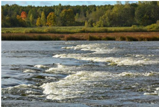
Daugavas krāces.

Noderīgi: maršruta karti drukātā formātā iespējams saņemt Jēkabpils novada TIC, digitāli to var lejuplādēt mājaslapā visit.jekabpils.lv .