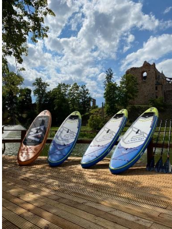
Dobeles pils skati.

Plašākai informācijai – www.facebook.com/Dobelespilsskati