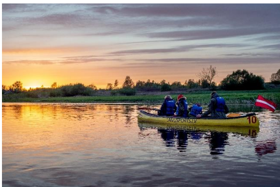
Ar laivām pa Lielupi Jelgavā.

Jauni iespaidi būs tiem, kas izvēlēsies doties pa Lielupi (no Bauskas) līdz pat tās ietekai jūrā. Maršrutā izveidotas īpašas pieturvietas ar informācijas stendiem un pontonu laipām, kur būs ērtāk pietāt, – Jelgavas novadā tās būs “Liedagos” Emburgā, Staļģenē, pie Jāņa Čakstes mājām “Auči” Salgales pagastā, pie Ānes muižas, Mierlaukos un “Vecdaudzenē” Valgundes pagastā, kā arī Lielupes ielā 14 Kalnciema pagastā.