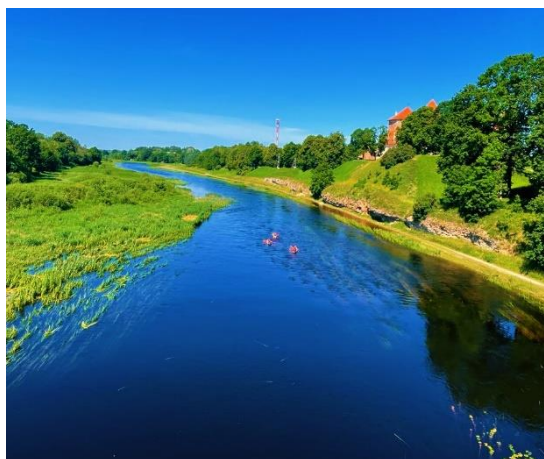
Mūsa pie Bauskas pils.

Noderīgi: laivu nomu šajos maršrutos un labiekārtotas atpūtas vietas piedāvā vairāki uzņēmēji, par kuriem plašāku informāciju var meklēt www.visit.bauska.lv . Nesen izdota arī praktiska tūrisma karte “Iekustini Lielupi”, kas noderēs visiem laivotājiem.