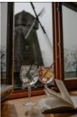
Atpūtas komplekss “Rožmalas”.

Adrese: Nameju iela 2, Ceraukste, Bauskas nov.; www.rozmalas.lv ; tālr. +371 26564580; e-pasts: info@rozmalas.lv .