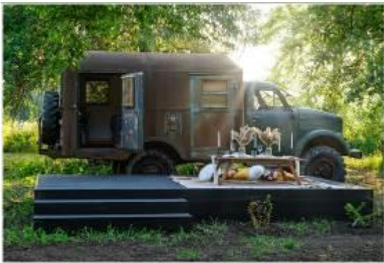
Naktsmītne "GAZ-63".