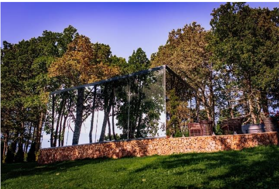
Spoguļnamiņš “Seven Mirrors”.

Adrese: “Seven Mirrors” spoguļmājas, Upeslejas – 1, Skrīveri.