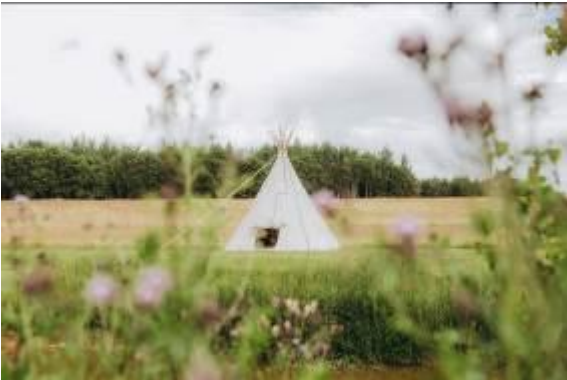
“Nomadic Homes” glempings “TIPI VILLAGE”.

Adrese: “Kadiķi”, Vītiņu pagasts; tālr. +371 26593118; e-pasts: nomadichomeslatvia@gmail.com.