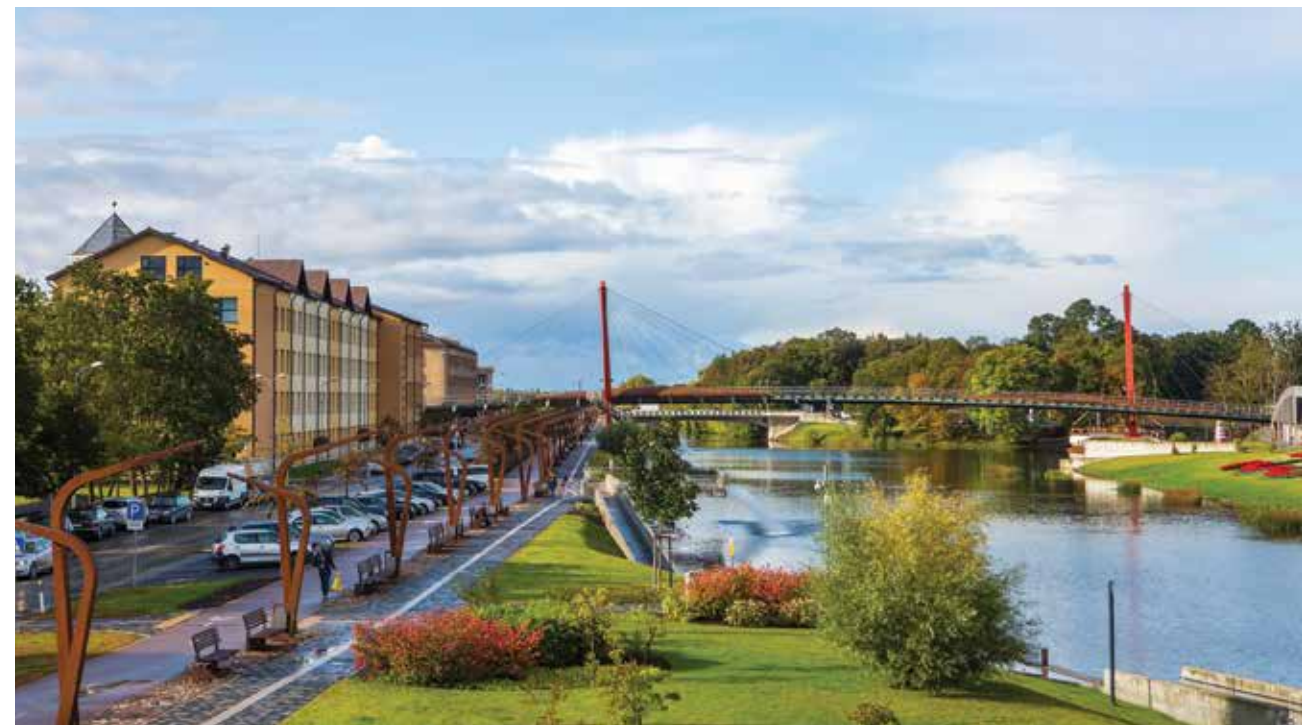
Blick auf den J. Čakste Boulevard und die Mitava-Brücke, 2019.

www.jelgava.lv Jelgava „Pilsēta izausmei!”